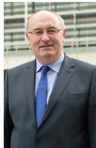
Г-н Фил Хоган, Европейски комисар по земеделието и развитието на селските райони

Конференцията е от стратегическа важност и е продължение на предишните годишни конференции на fi-compass , посветени на финансовите инструменти в рамките на ЕЗФРСР, проведени в Дъблин (2015 г.), Брюксел (2016 г.) и Париж (2017 г.), както и серията от шест макрорегионални конференции, проведени във Виена (2015 г.), Рига (2015 г.), Мадрид (2016 г.), Рим (2016 г.), Варшава (2016 г.) и Талин (2017 г.).