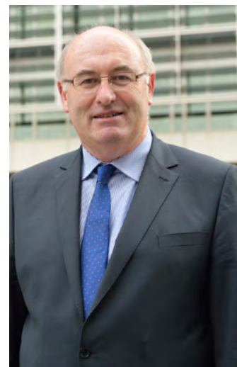
M. Phil Hogan, Commissaire européen à l'agriculture et au développement rural

Cette conférence fait suite aux précédentes conférences annuelles fi-compass dédiées aux instruments financiers mobilisant du FEADER qui ont eu lieu à Dublin en 2015 et à Bruxelles en 2016 ainsi qu'aux six conférences macro-régionales qui se sont déroulées à Vienne en 2015, à Riga en 2015, à Madrid en 2016, à Rome en 2016, à Varsovie en 2016 et à Tallin en 2017.