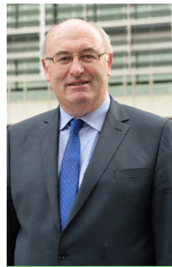
M. Phil Hogan, Commissaire européen à l'agriculture et au développement rural

Cette conférence fait suite aux précédentes conférences annuelles fi-compass dédiées aux instruments financiers mobilisant du FEADER qui ont eu lieu à Dublin en 2015 et à Bruxelles en 2016 ainsi qu'aux six conférences macro-régionales qui se sont déroulées à Vienne en 2015, à Riga en 2015, à Madrid en 2016, à Rome en 2016, à Varsovie en 2016 et à Tallin en 2017.